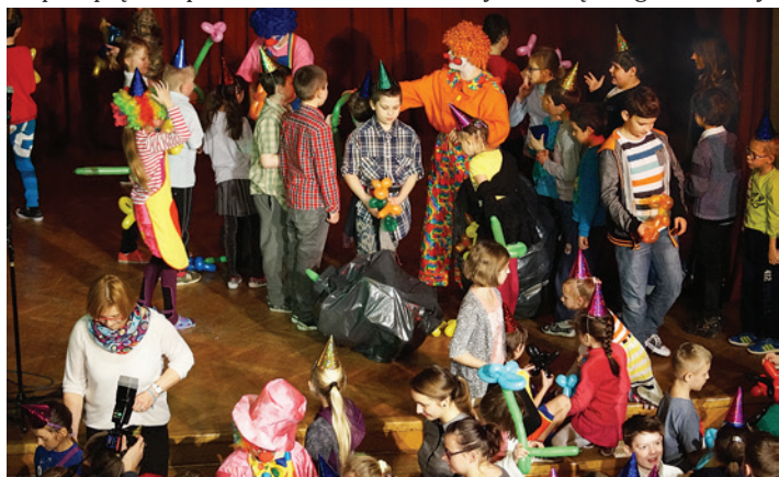
Na parkiecie Domu Narodowego wirowało wiele par.

Barwnie i wesoło było 27 stycznia w Domu Narodowym w Cieszynie. Wszystko za sprawą licznej grupy dzieci biorących udział w II Cieszyńskim Balu Aniołów . Tegoroczna edycja balu organizowanego po raz kolejny przez Międzynarodową Organizację Soroptimist International Klub w Cieszynie skupiła aż 140 dzieci z OREW w Cieszynie, Zespołu Placówek Szkolno-Wychowawczo-Rewalidacyjnych oraz klas integracyjnych szkół podstawowych powiatu cieszyńskiego. Uczniowie ze Skoczowa, Wisły, Ustronia i oczywiście Cieszyna – bawili się pod okiem wychowawców i opiekunów oraz licznej grona wolontariuszy. Sala Domu Narodowego przygotowana przepięknie przez studentów Uniwersytetu Śląskiego w Cieszynie