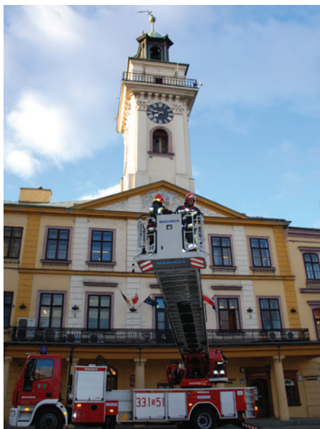
Jednostka ratownicza straży pożarnej w akcji.