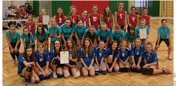
W Ispaniejskiej nowości sali rywalizowano w mini-siatkówce.