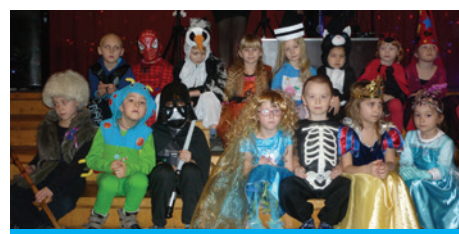
Nie zabrakło misiów, pielęgniarek i księżniczek.

Dzięki pomocy i zaangażowaniu rodziców uczestnicy balu mogli skosztować pysznych ciast oraz kanapek. Przedszkolaki przebrane w piękne i kolorowe stroje mogły wcielić się w rolę swoich ulubionych bohaterów, takich jak piraci, księżniczki, wróżki, itp.