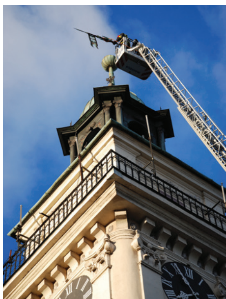
Ratusz stał się krótszy o około 3 metry.