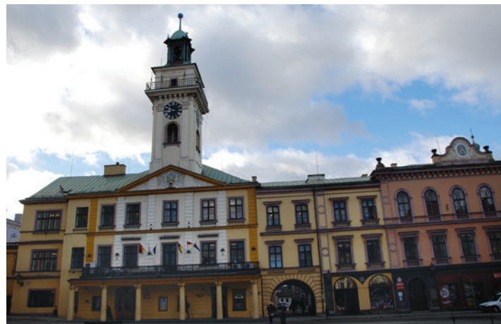
Nowe oblicze cieszyńskiego magistratu...