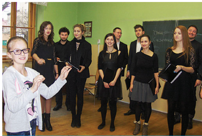
Muzyka łączy pokolenia...