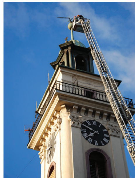
Usuwanie zagrażającej bezpieczeństwu iglicy.