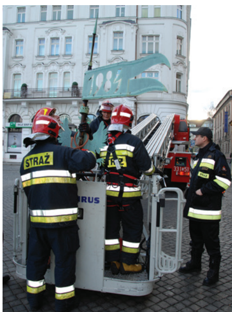
Akcja zakończona podwinięciem.