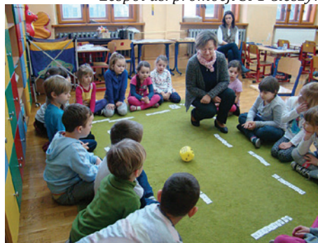
Uczniowie klasy pierwszej pokazali, co potrafią.