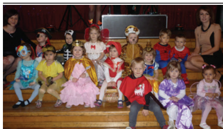
Bal odbył się w Domu Narodowym.

3 lutego w Domu Narodowym odbył się coroczny bal przebierańców z udziałem dzieci z Przedszkola nr 8 w Cieszynie.