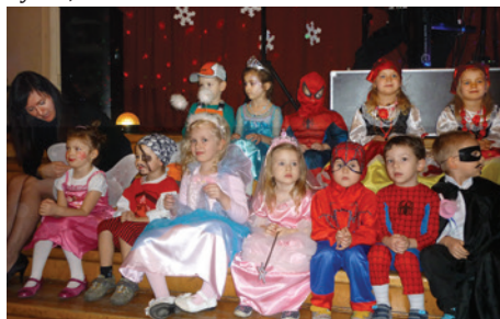
Dzieci były przebrane w ciekawe stroje.

Na bal przybyli również rodzice przedszkolaków. Jak co roku nie brakowało atrakcji, takich jak zabawa przy muzyce na żywo, tańce z rodzicami.