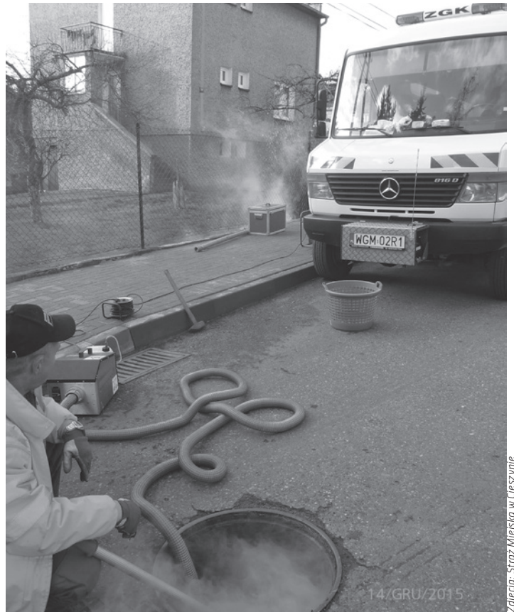
Kontrolne zadymianie studzienki kanalizacyjnej to stosunkowo prosta metoda weryfikacji obiektów, które ją zasilają.

Już pierwsze wyniki wspólnych interwencji podjętych przez Straż Miejską, Wydział Ochrony Środowiska i Rolnictwa Urzędu Miejskiego w Cieszynie, Zakład Gospodarki Komunalnej w Cieszynie Sp. z o.o. oraz Miejski Zarząd Dróg ujawniły, że w wielu przypadkach za dotychczasowym brakiem podłączenia znajdują się „głęboko skrywane tajemnice”. I tak przykładowa kontrola posesji w rejonie ul. Odległej wykazała, że właściciele unikali podłączenia, odprowadzając ścieki bezpośrednio do cieku wodnego dopływają-