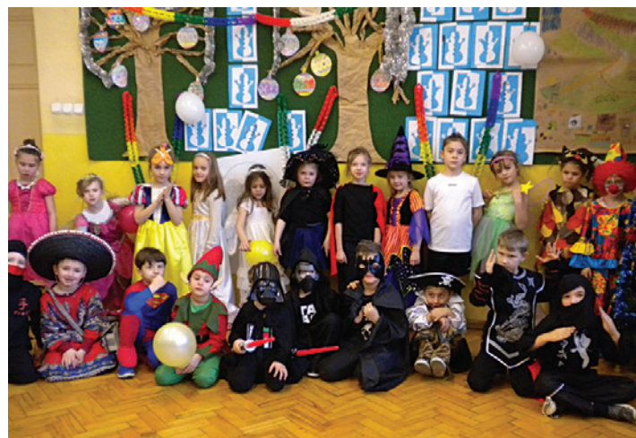
Pomysłowość uczniów, jeżeli chodzi o ubiór, nie znała granic.