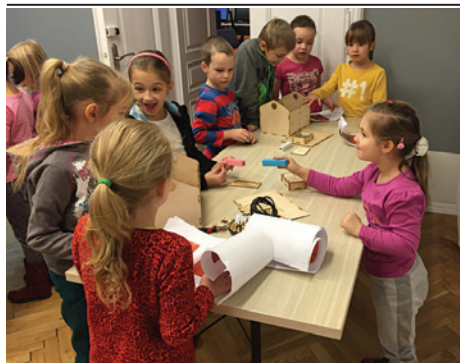
Zabawa w bibliotece była przednia.

Uczniowie SP1 lubią czytać i chętnie odwiedzają szkolną bibliotekę. Równie chętnie odwiedzili Bibliotekę Miejską, w której zaplanowano im bardzo ciekawe zajęcia. Oto jak czas spędzony wśród książek – i nie tylko – zapamiętali uczniowie i nauczyciele naszej szkoły: „Pierwszy tydzień stycznia klasy pierwsze zaczęły bardzo pracowicie. Udały się z wizytą do Biblioteki Miejskiej w Cieszynie, na warsztaty multimedialne budowania i programowania robotów. Zajęcia były bardzo ciekawe, zarówno chłopcy jak i dziewczyny dzielnie walczyli ze śrubokrętami w rękę, aby zbudować swojego robota. Następnie przy pomocy iPad-ów uczniowie mogli obserwować z bliska przemieszczające się w przestrzeni kosmicznej roboty i statki kosmiczne”.