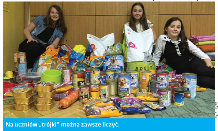
Na uczniów „trójki” można zawsze liczyć.