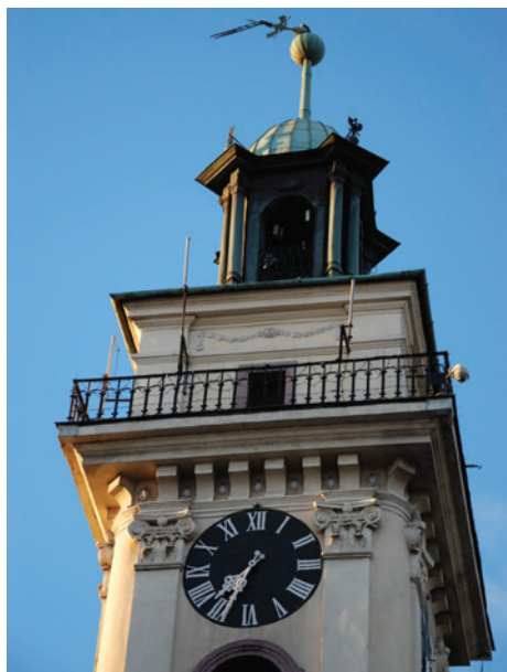
Nadłamana iglica na wieży ratuszowej.